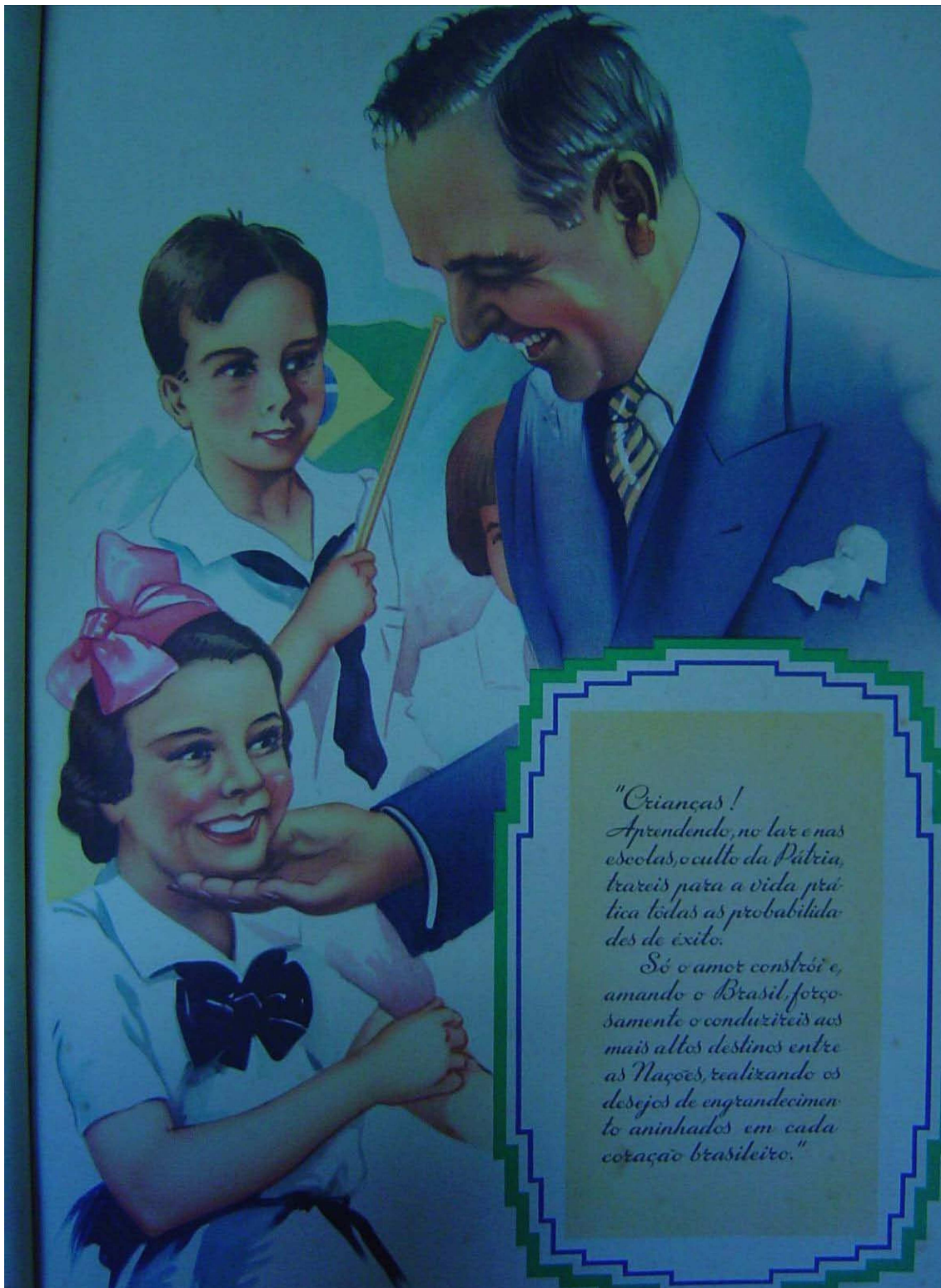
Ilustração 7: Construção do Estado Nacional no imaginário das crianças e jovens através da educação.