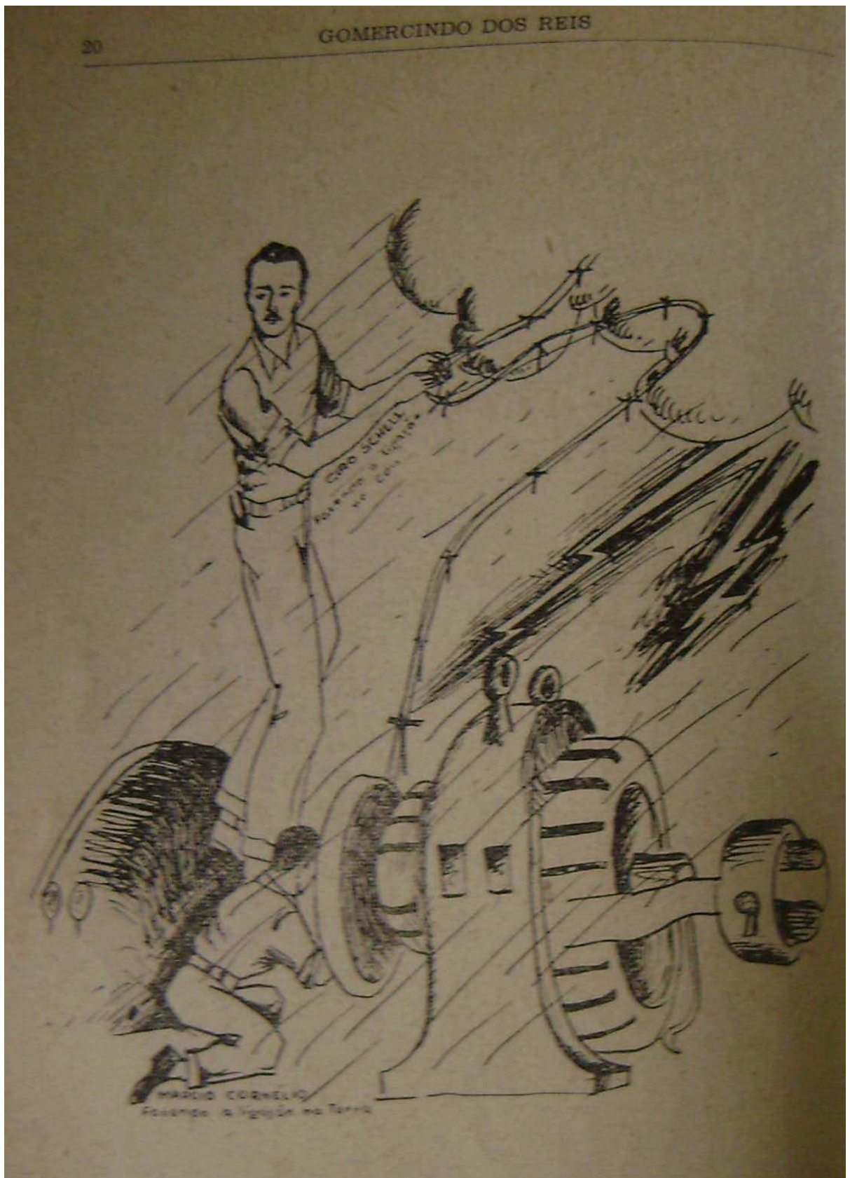
Ilustração 2: “Usina Celeste” publicada no livro “Jardim de Urtigas”, de 1957, p. 20.