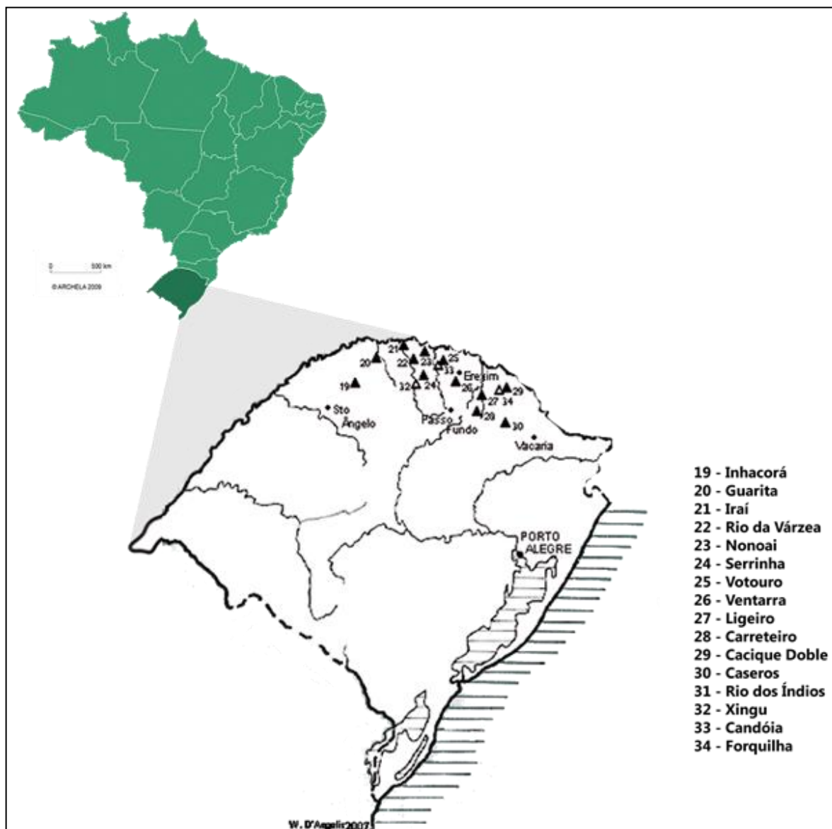
Figura 1: Mapa de localização dos aldeamentos kaingang no Rio Grande do Sul. Colaboração: Rubens Martinello 3 .

O aldeamento indígena kaingang em estudo foi criado a partir da política oficial de aldeamento na Província do Rio Grande do Sul, datada de 1846, no entanto, sua oficialização ocorreu apenas em 1991, estando sob a administração regional da FUNAI de Passo Fundo (RS). Os kaingang que formaram esta TI vieram de Santa Catarina. A extensão das terras desse aldeamento corresponde a 4.565 hectares, localizando-se totalmente em um único município. Atualmente, o número de indígenas que compõe essa tribo corresponde, segundo o IBGE (2010), a aproximadamente 1.524 habitantes.