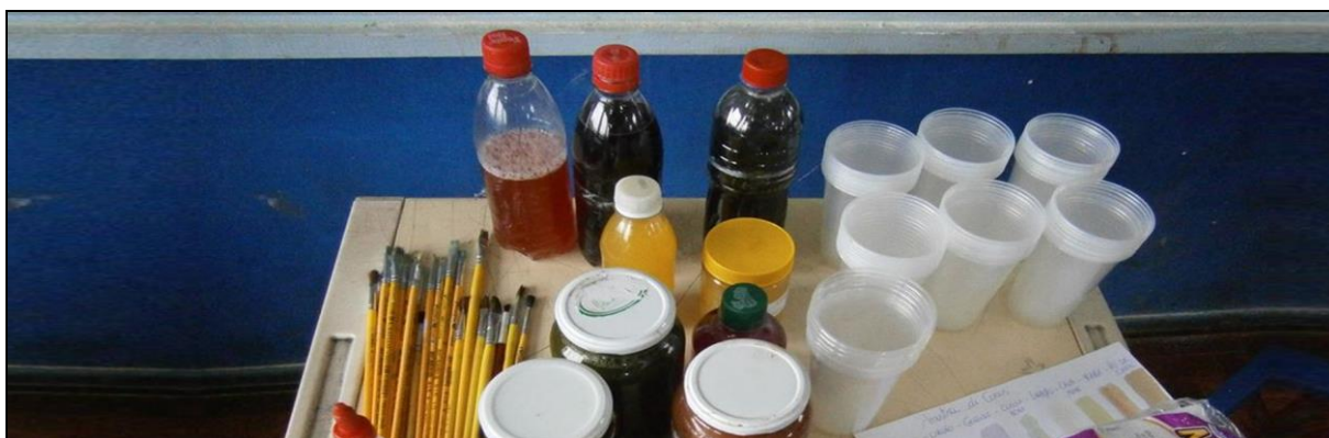
Figura 22: Parte do material disponibilizado para os desenhos com tintas naturais.

A fim de construir um trabalho diferenciado, foi proposto que expressassem sentimentos através da pintura com tintas naturais, utilizando a imaginação para demonstrar o que sentiram com a realização das oficinas. O material foi disponibilizado de forma que os alunos escolhessem as cores que desejassem para criar seus trabalhos, como a figura 22.