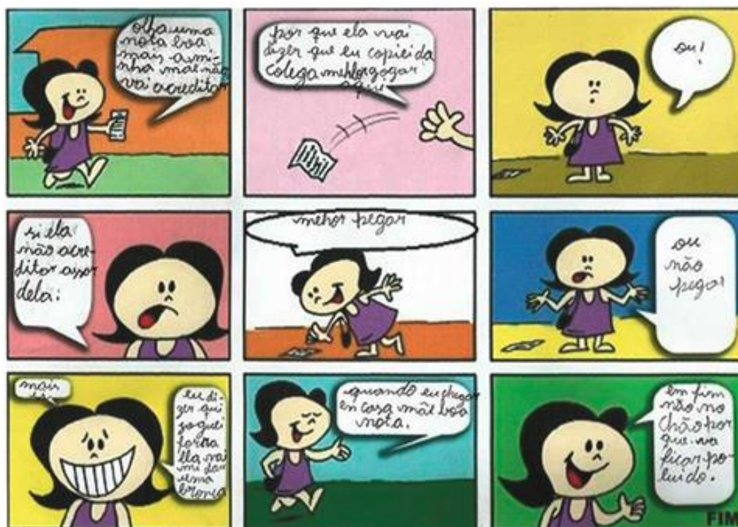
Figura 34: História criada por aluno

Outros quatro alunos demonstraram uma dificuldade maior ainda em criar a história solicitada, fugindo do tema proposto a essa atividade. Uma aluna concluiu sua história abandonando o papel no chão. Nesse caso, nota-se que a aluna não demonstrou um enfoque ecológico na sua história, nem relacionou-a com as aulas. Um aluno criou a história a partir de um bilhete de cinema, o qual sujou e não valeu mais nada. Nessa história, também, não encontramos a relação com o meio ambiente, além de demonstrar muita dificuldade na escrita em língua portuguesa.