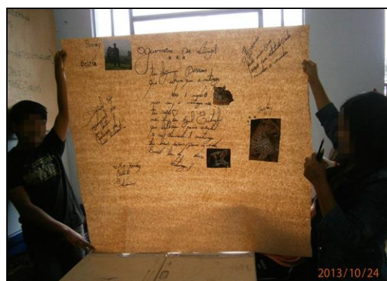
Figuras 20 e 21: Painéis construídos pelos grupos de alunos.