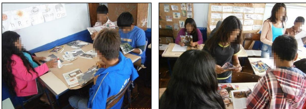
Figuras 18 e 19: Construção dos cartazes com frases e recortes de revistas.

Finalizando as atividades dessa oficina, os alunos foram desafiados a criar um painel e uma frase, em grupos, considerando os assuntos abordados durante a aula. Foram utilizados os seguintes materiais: revistas para recorte, tesoura, cola branca, papel pardo, canetões. O objetivo dessa atividade consistiu em relacionar os conhecimentos sobre preservação da natureza e a transformação causada pelo homem, bem como verificar entre os alunos o desenvolvimento de atividades de construção textual, através de frases para o cartaz. Conforme as figuras abaixo mostram, o trabalho foi iniciado nessa aula.