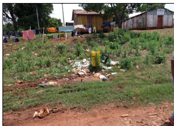
Figuras 27 e 28: Observação de elementos no espaço do aldeamento.

Durante o trajeto, utilizando um saco plástico, coletamos alguns resíduos sólidos lançados na natureza pela população. Caminhamos debaixo do sol quente, durante vários minutos, então perguntei sobre qual caminho deveríamos seguir, pela rua de terra, no sentido