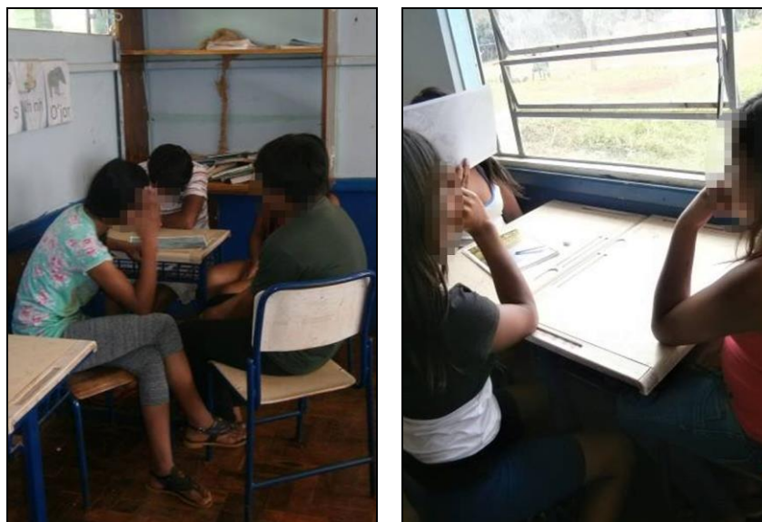
Figuras 8 e 9: Análise de imagens em sala de aula.

transformações que o ser humano faz no lugar onde vive. Os alunos citaram as construções, as roças, as estradas construídas, as moradias; Citaram também a construção de pontes, de reservatório para água, a própria escola. Cada transformação realizada pelo homem, tem sua finalidade, de acordo com as informações trazidas pelos alunos durante o debate. As figuras abaixo retratam a atividade de observação de imagens.