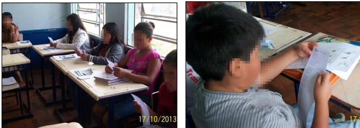
Figuras 16 e 17: Apreciação da música pelos alunos.

Na sequência realizamos uma atividade de apreciação musical, através da canção “herdeiros do futuro” do compositor “Toquinho” (em anexo), cuja letra foi distribuída aos alunos e posteriormente ouvimos a música, conforme mostram as figuras 16 e 17: