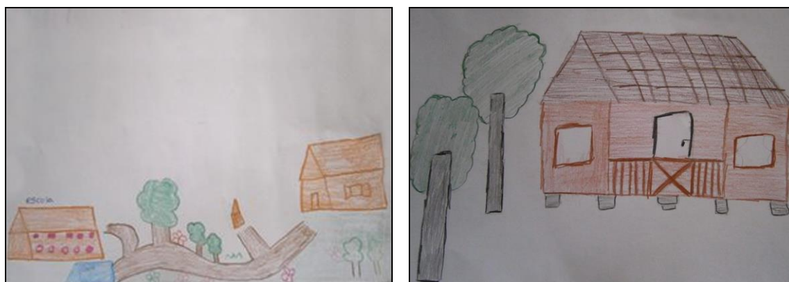
Figuras 6 e 7: Desenhos do trajeto casa-escola.

Outros, porém, detalharam mais os aspectos próximos de sua casa, dando ênfase ao trajeto realizado da casa até a escola. Usando mais detalhes e menos elementos no desenho. Nota-se o cuidado com o desenho, usando cores fortes, caprichando na pintura.