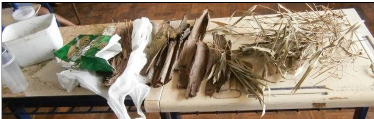
Figura 10: Alguns dos materiais da natureza utilizados nos trabalhos.

A experiência de criação das maquetes pelos grupos foi bastante positiva. Da fase inicial de conversa, análise e imaginação do espaço, desenvolveram-se atitudes dialógicas, predominando o respeito e a divisão de tarefas, onde todos puderam participar da atividade. Entretanto, alguns grupos tiveram dificuldades de estabelecer os passos para o desenvolvimento do trabalho, gerando aborrecimento entre alguns de seus membros. Outros relataram dificuldades em solicitar material emprestado, pois alguns colegas de outros grupos se negavam a ceder material que havia de sobra.