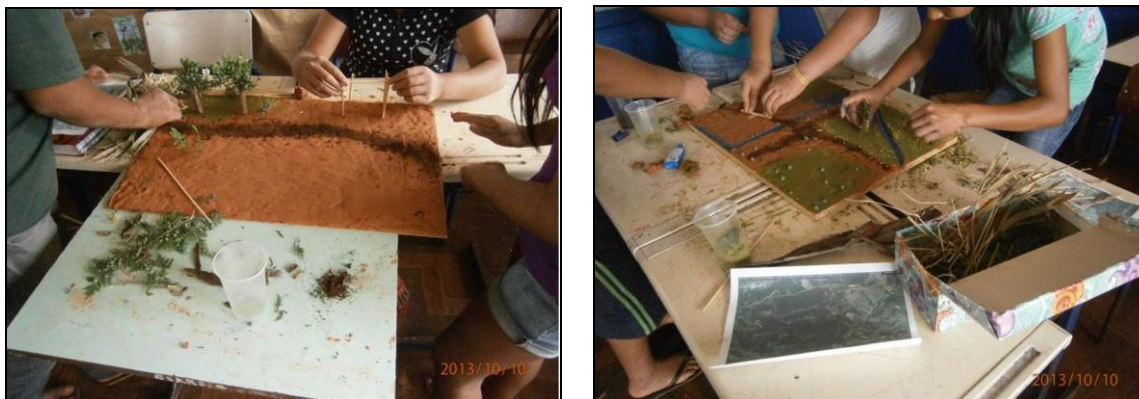
Figuras 11 e 12: Construção da maquete em grupos.

Os alunos representaram espaços da comunidade que apreciam ou julgam bonito. A maioria dos grupos criou áreas com bastante vegetação preservada e a presença de rios e estradas. Usaram erva-mate ou galhos de árvores para representar as matas, pedrinhas e terra para as estradas, alguns usaram folhas e flores, representando as belezas observadas no espaço da TI.