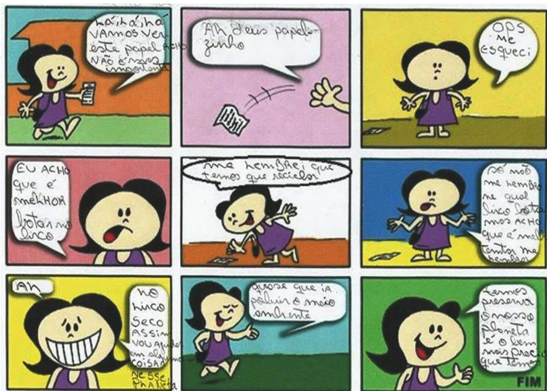
Figura 33: História criada por aluno