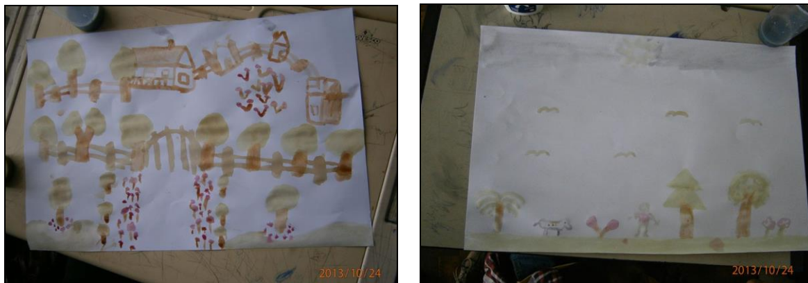
Figuras 25 e 26: Desenhos criados a partir de tintas naturais.

Como pode ser observado nas pinturas, os alunos apresentam uma ligação bastante forte com o meio natural, desenhando árvores, pinheiros, flores, pássaros, borboletas. Há alguns desenhos que retratam as moradias e a vida cotidiana; Um dos trabalhos criados apresentou um avião no céu, o aluno comentou que “é daqueles aviões de passar veneno nas lavouras”, demonstrando a presença das tecnologias no processo produtivo agrícola no entorno do aldeamento.