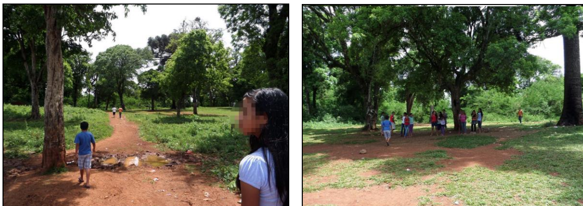
Figuras 29 e 30: Contemplação da natureza no aldeamento.

Os educandos precisam ser estimulados a compreender diferentes assuntos. A escola, nesse contexto, deve ser o local onde o aluno pode expressar as suas necessidades, onde tenha alguém que lhe dê espaço para ser, para crescer e para criar seu mundo, conforme seus desejos e sua realidade. A escola precisa ter suas regras, ser respeitada e ser referência, desse modo, defendemos uma “liberdade regrada”, em que os estudantes possam se sentir livres para opinar e também tenham responsabilidades, guiados pelas relações de respeito e compreensão.