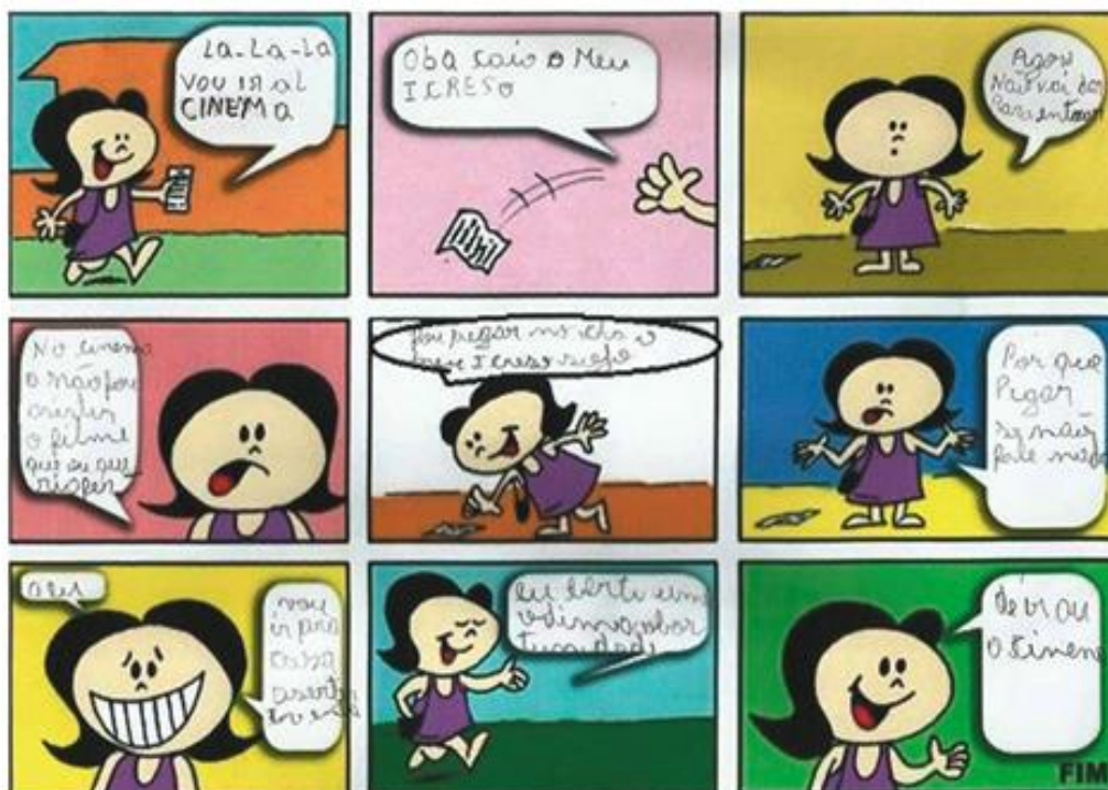
Figura 35: História criada por aluno

Fica evidente que alguns alunos sentem mais dificuldades em criar histórias, descrever personagens ou relacionar com a geografia. Há casos em que a dificuldade de escrever corretamente na língua portuguesa é latente, o que mostra que os alunos sabem relacionar os conhecimentos, mas não conseguem escrever corretamente, o que dificulta o processo de ensino-aprendizagem, pois, ao realizar leituras e interpretações, esse problema emerge. Tal dificuldade se apresenta pelo bilinguismo, muitos alunos confundem vogais ao escrever em língua portuguesa por terem sido alfabetizados na língua kaingang.