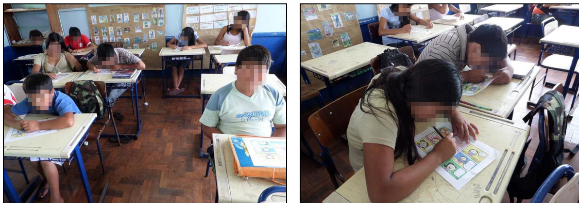
Figuras 31 e 32: Criação da história ilustrada.

Após a criação das histórias, todas foram recolhidas para leitura e análise. Concluindo a última oficina, trabalhamos o paladar, único sentido não abordado anteriormente. Faltando poucos minutos para a conclusão do período, partilhamos um bolo de milho, que foi especialmente feito para esse momento. Momentos antes da degustação do alimento, comentamos sobre a importância de dividirmos o que sabemos e o que aprendemos, sobre a importância de tornar nossas vidas mais doces e saborosas, através dos conhecimentos e da amizade que fazemos na escola. Assim, agradei pela participação dos alunos nas atividades e partilhamos o alimento.