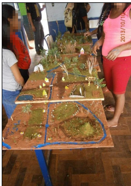
Figura 13: Maquetes construídas pelos alunos kaingang.

A atividade de apresentação das maquetes para os colegas não foi possível neste dia, devido ao pouco tempo disponível ao final da aula, por isso, a apresentação foi deixada para a aula posterior, mas, os alunos apresentavam aos outros suas criações à medida que estes iam chegando e fazendo perguntas. A figura abaixo mostra a exposição dos trabalhos durante o intervalo da aula.