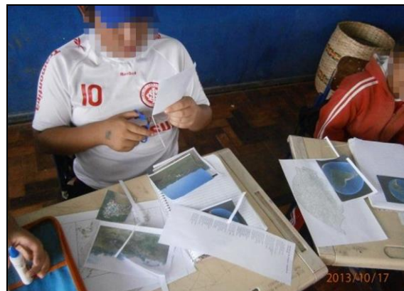
Figuras 14 e 15: Recorte e colagem das imagens nos cadernos.