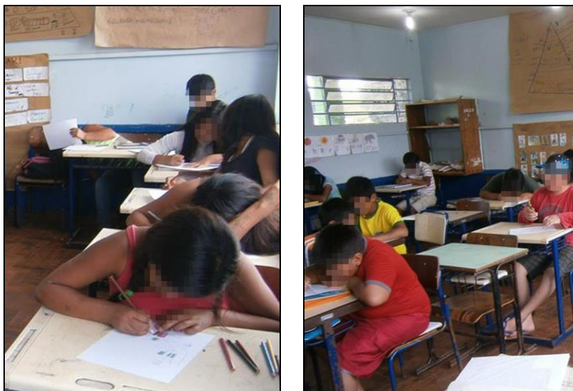
Figuras 2 e 3: Alunos desenhando o trajeto casa-escola.

Ficou evidente, neste primeiro encontro, que alguns alunos apresentavam mais dificuldades para imaginar e recordar o espaço vivido, demorando mais tempo para desenvolver o desenho ou dizendo “eu não sei desenhar”. A criação do desenho foi sendo incentivada junto a cada um, pois o importante não é a beleza do desenho, mas sim o que esse desenho representa do seu cotidiano, da sua vida neste espaço. Como afirma Moreira “[...] no ato de desenhar, pensamento e sentimento estão juntos” (2005, p. 24). Desse modo, todos construíram os seus desenhos e demonstraram-se curiosos com a atividade, a qual foi valorizada pela significação que teve para cada um.