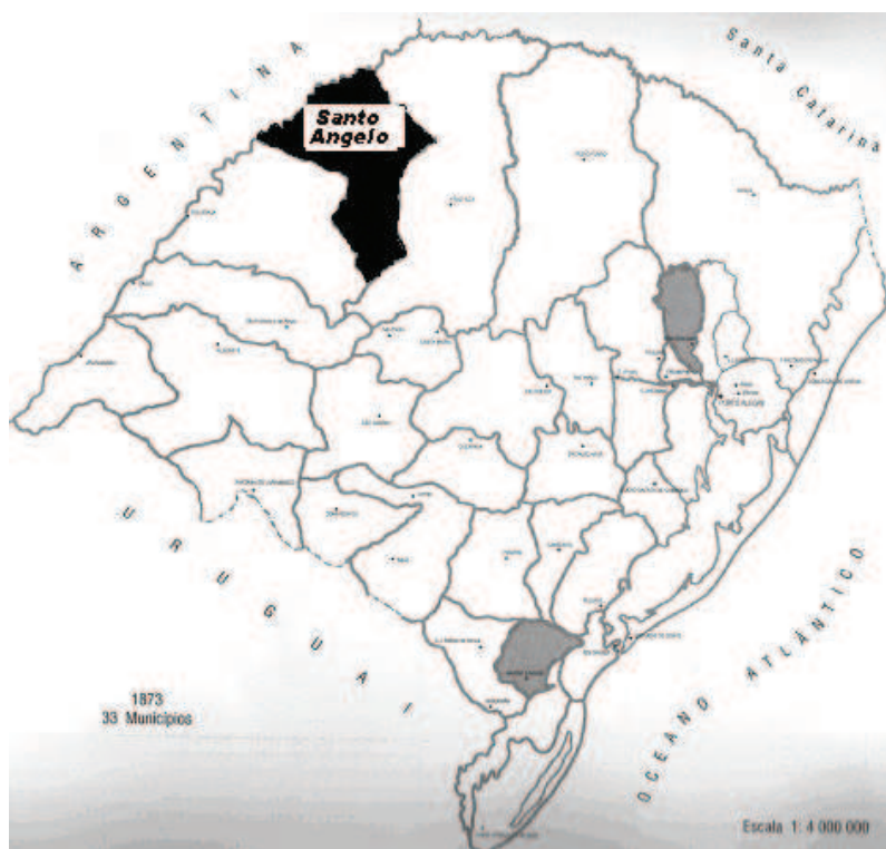
Figura 1 -Rio Grande Sul em 1873, destaque para o município de Santo Ângelo 68

Santo Ângelo, um dos maiores municípios do Rio Grande do Sul, situado no Noroeste do Estado, no início do século XX, tinha grande parte do seu território coberto por matas. Foi um dos municípios em que mais esteve presente a política de colonização do governo de Borges de Medeiros. Politicamente, Santo Ângelo esteve durante quase todo o período da Primeira República, sob o domínio do Coronel Bráulio Oliveira, chefe local do PRR, sendo intendente municipal entre 1900-1916 e 1920-1924.