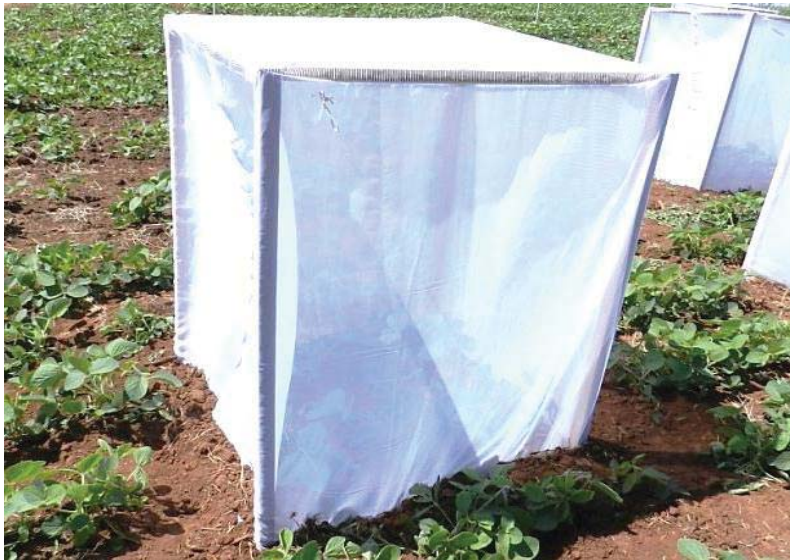
Figura 1. Gaiola de proteção das plantas da unidade experimental.

insetos mortos foi realizado a cada dois dias, através de abertura vertical, numa das laterais da gaiola, dotada de fecho “velcro”.