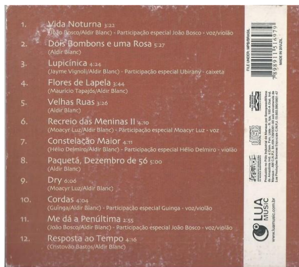
Figura 2 - Contracapa do disco “ Vida Noturna ”