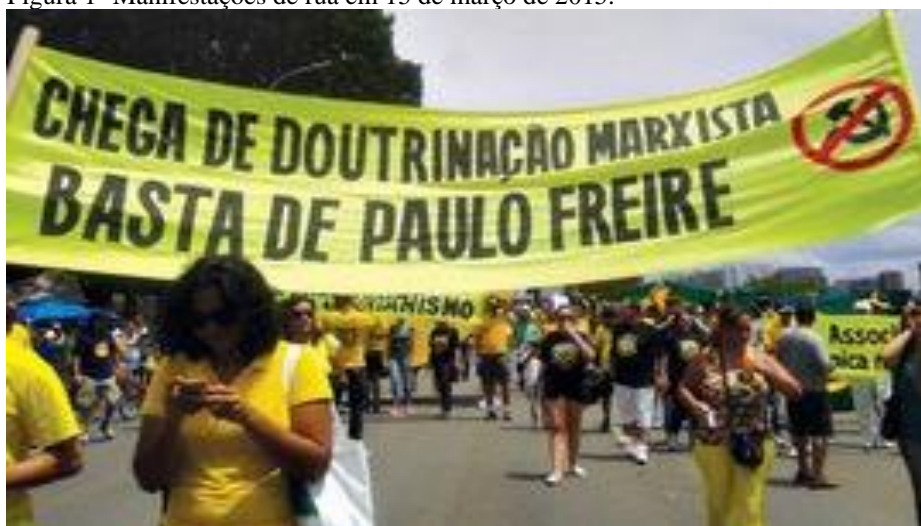
Figura 1- Manifestações de rua em 15 de março de 2015.