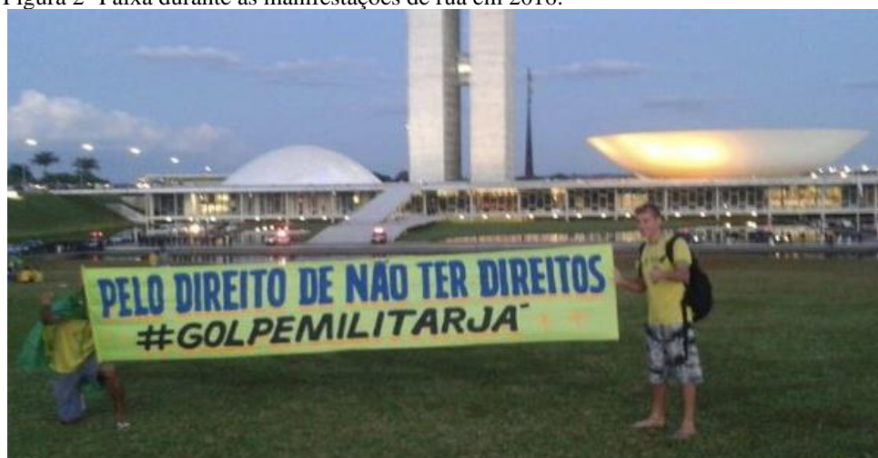
Figura 2- Faixa durante as manifestações de rua em 2016.

Fonte: https://twitter.com/marciatiburi/status/1362364344726675459?lang=fi . Acesso em: 15/09/2021.