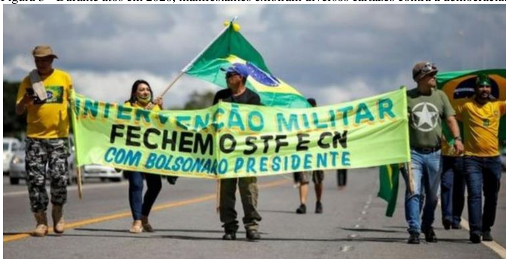
Figura 3 - Durante atos em 2020, manifestantes exibiram diversos cartazes contra a democracia.

Fonte: SERGIO LIMA/AFP E GETTY IMAGES. Disponível em: https://www.bbc.com/portuguese/brasil-57394680 . Acesso em: 15/09/2021.