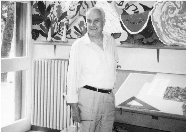
Figura 6 – Loris Malaguzzi

Disponível em: https://www.reggiochildren.it/en/reggio-emilia-approach/loris-malaguzzi/ . Acesso em: 13 de maio de 2021.