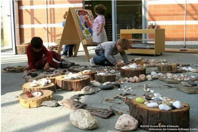
Figura 11 – Crianças explorando diferentes materiais em escola de Reggio Emilia.

Disponível em: https://www.dialogosviagenspedagogicas.com.br/blog/a-primavera-de-1945 Acesso em: 13 de maio de 2021.