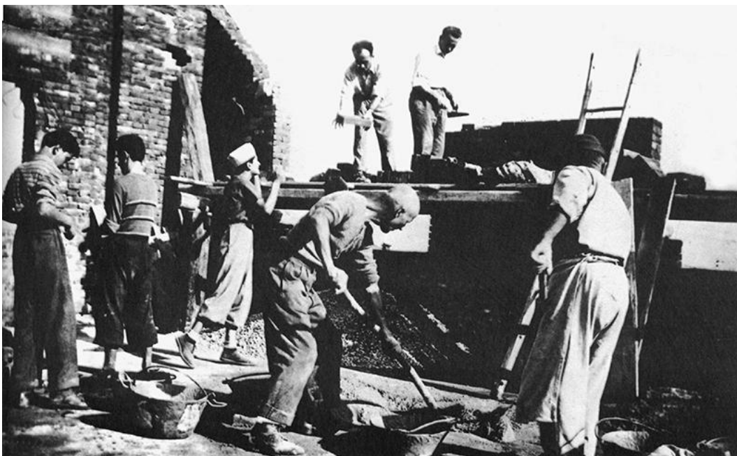
Figura 7 – Voluntariado na construção da escola.

Disponível em: https://www.reggiochildren.it/en/reggio-emilia-approach/timeline-en/ Acesso em: 13 de maio de 2021.