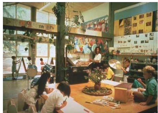
Figura 10 – Organização do ambiente em escola de Reggio Emilia.

Disponível em: https://aldeiadospequeninos.blogs.sapo.pt/6219.html Acesso em: 13 de maio de 2021.