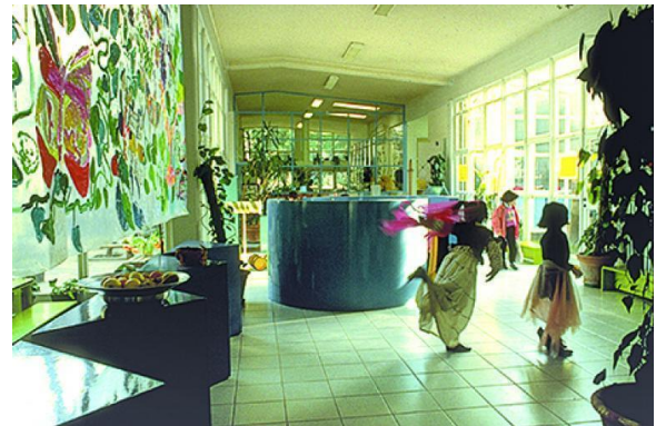
Figura 5 – A revista indicou a Escola Diana para representar todas as pré-escolas de Reggio Emilia.

Disponível em: https://www.reggiochildren.it/en/reggio-emilia-approach/timeline-en/ Acesso em: 13 de maio de 2021.