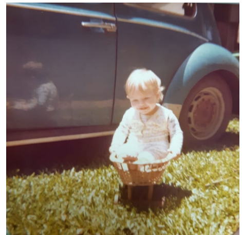
Figura 1- Criança.