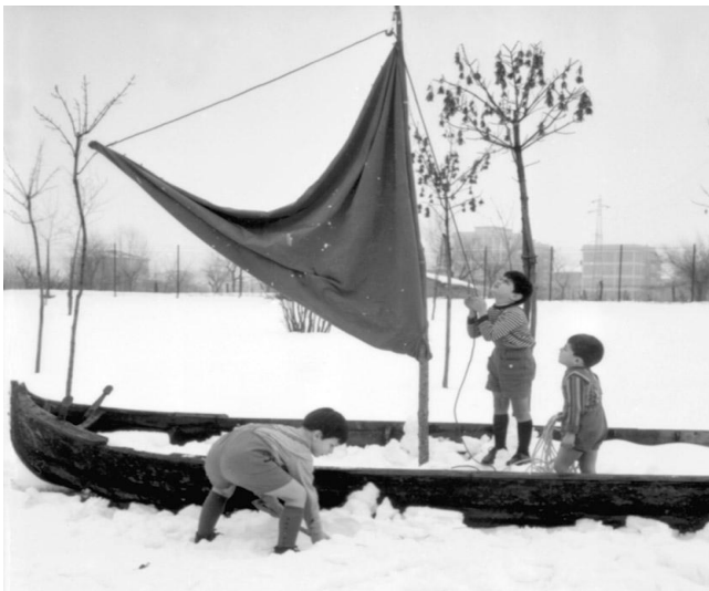
Figura 8 – Crianças brincando em 1963.

Disponível em: https://www.reggiochildren.it/en/reggio-emilia-approach/timeline-en/ Acesso em: 13 de maio de 2021.