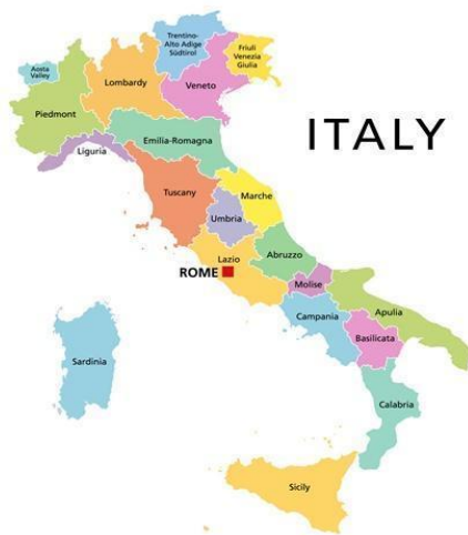
Figura 2 – Mapa da Itália.

Disponível em: https://www.romapravoce.com/mapa-da-italia-regioes-roiteiro/ Acesso em: 13 de maio de 2021.