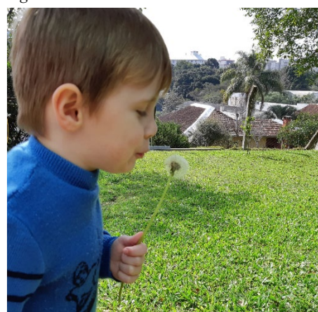
Figura 12 – Potencialidades.