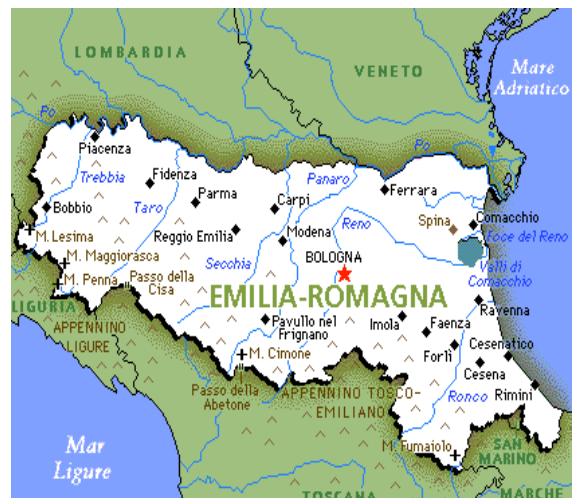
Figura 3 – Mapa da região Emilia Romagna, localização de Reggio Emilia.

Disponível em: https://br.pinterest.com/pin/412923859560943615/ Acesso em: 12 de maio de 2021.