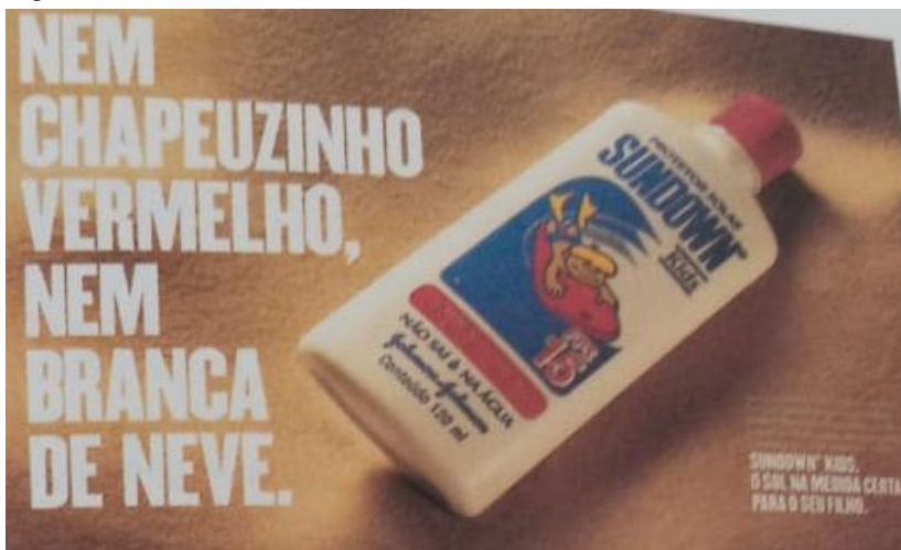
Figura 1 - Texto utilizado no encontro 1

Após o diálogo inicial, a professora pesquisadora apresentou o texto de imagem (Figura 1) que seria utilizado no encontro. Ao lhe entregar o texto, solicitou que o estudante o observasse para posteriormente responder algumas questões.