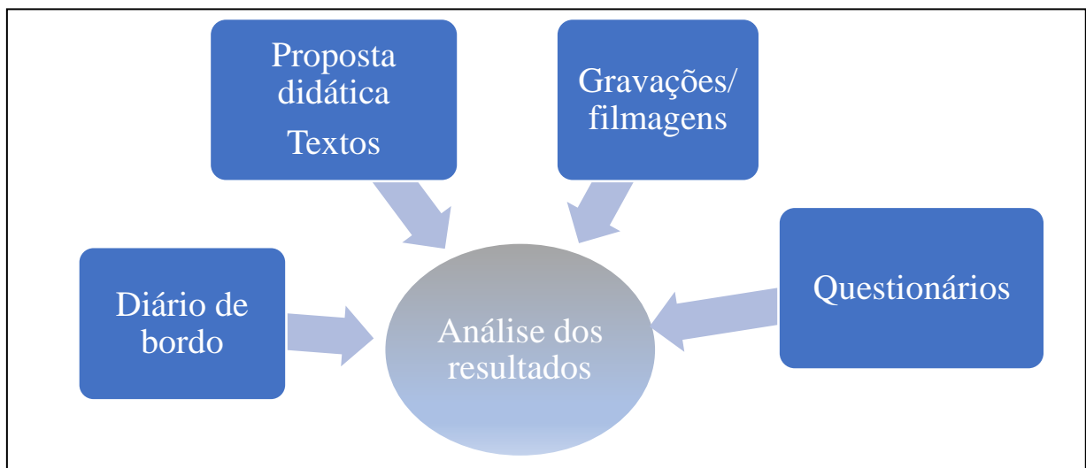
Figura 3 - Instrumentos de coleta de dados utilizados na pesquisa

Os instrumentos que foram utilizados para a coleta de dados deram ênfase aos registros de forma mais ampla ao final de cada encontro, pois foi aproveitado ao máximo o uso de cada ferramenta para a coleta de todos os dados encontrados em cada aula, conforme indicado na Figura 3.