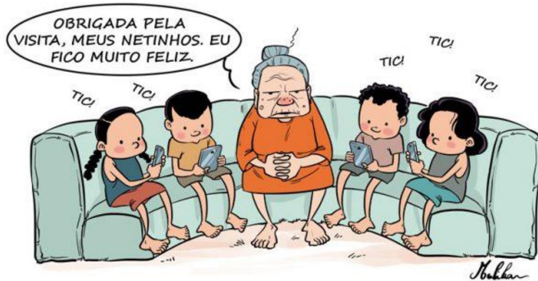
Figura 2 - Texto não verbal utilizado no encontro 4