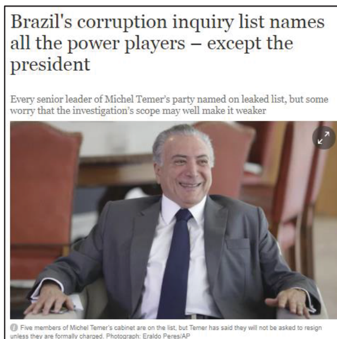
Imagem 9- Brazil's corruption inquiry list names all the power players-except the president- The Guardian

Fonte: Disponível em:< http://www.theguardian.com/world/2017/mar/15/brazil-corruption-investigation-list-politicians-michel-temer >. Acesso em: 05 nov. 2017.