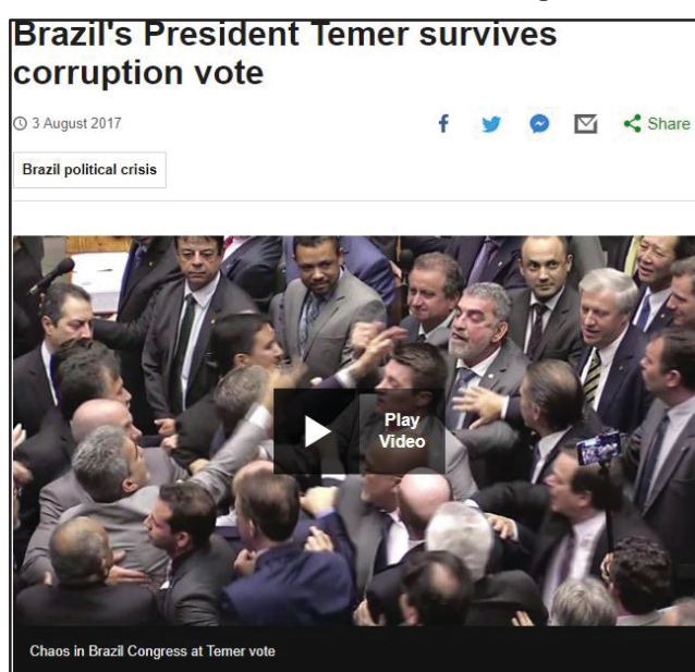
Imagem 11- Brazil's President Temer survives corruption vote- BBC News