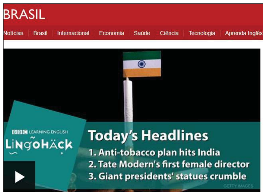
Imagem 4- Anti-tobacco plan hits India