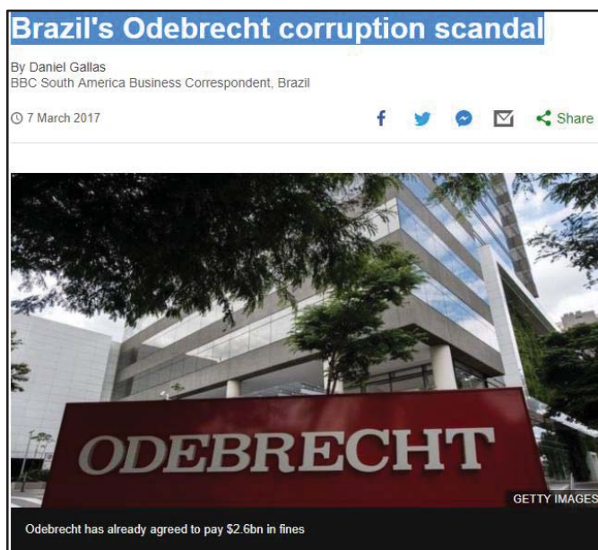
Imagem 8- Brazil's Odebrecht corruption scandal- BBC News