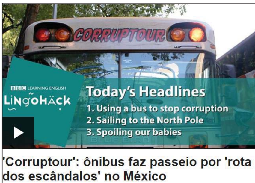
Imagem 10- Spoiling our babies