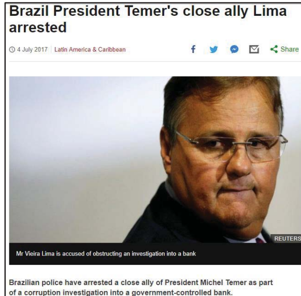
Imagem 5- Brazil President Temer's close ally Lima arrested- BBC News