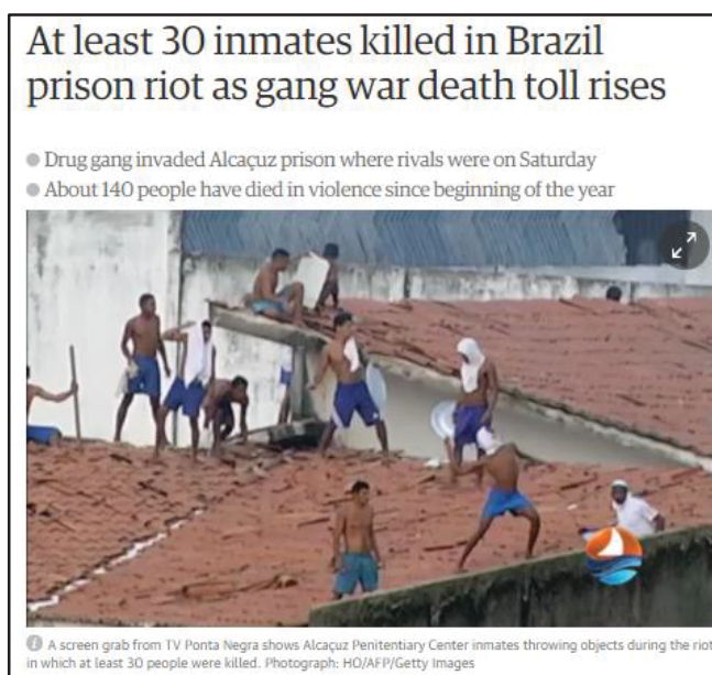
Imagem 3- At least 30 inmates killed in Brazil prison riot as gang war death toll rises - The Guardian