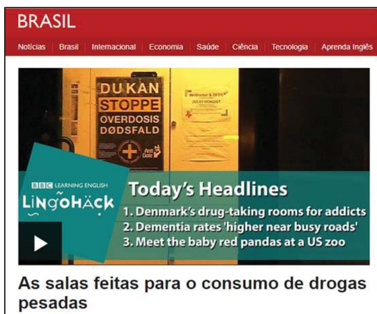
Imagem 1- Denmark's drug- taking rooms for addicts