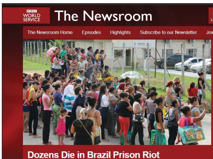
Imagem 2- Dozens die in Brazil prison riot- BBC News