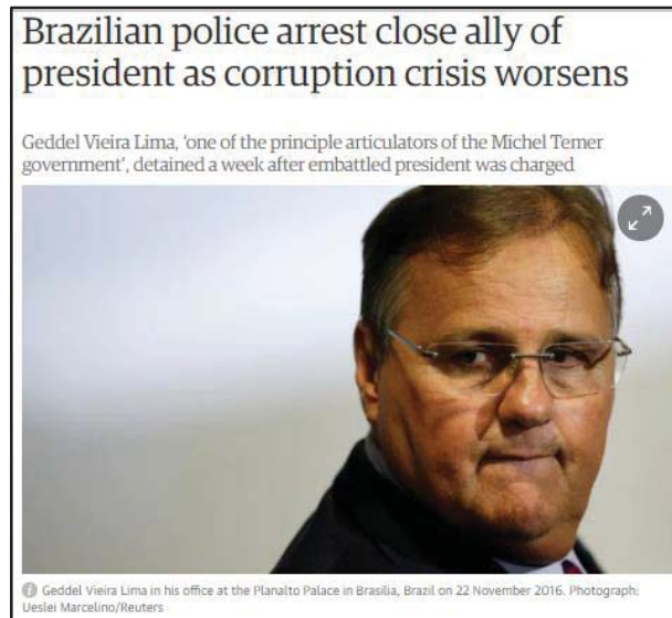
Imagem 6- Brazilian police arrest close ally of president as corruption crisis worsens- The Guardian