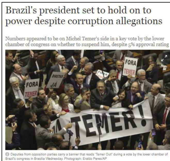
Imagem 12- Brazil's president set to hold on to power despite corruption allegations- The Guardian