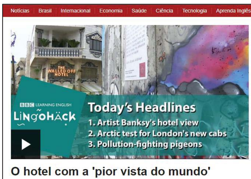
Imagem 7- Artist Banksy's hotel view