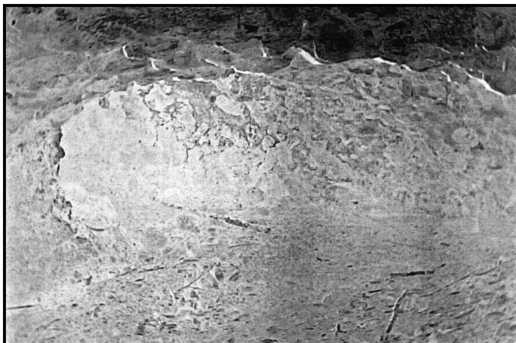
Figura 2 – Caverna onde o fugitivo teria se escondido durante o período de fuga