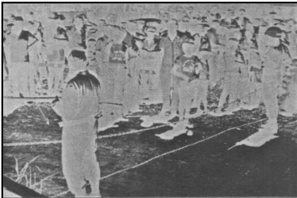
Figura 4 – Cerco policial ao destacamento do 13º BPM, tendo em vista a possibilidade de linchamento