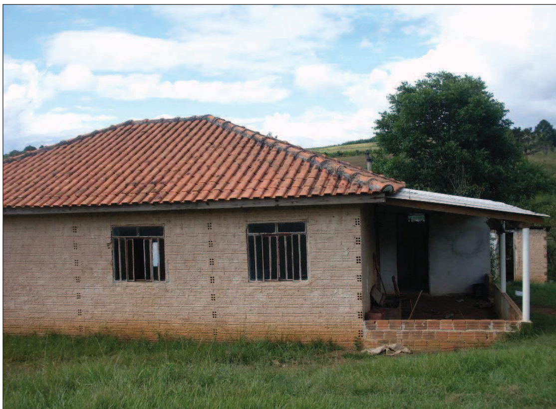
Figura 9: Casa de Adelir/P.A. Ernesto Che Guevara

da família de Adelir. E é nesse cotidiano que vive ele e sua família, hoje sem reclamar das privações sofridas, mas sabendo que falta muito para que todos tenham oportunidades.