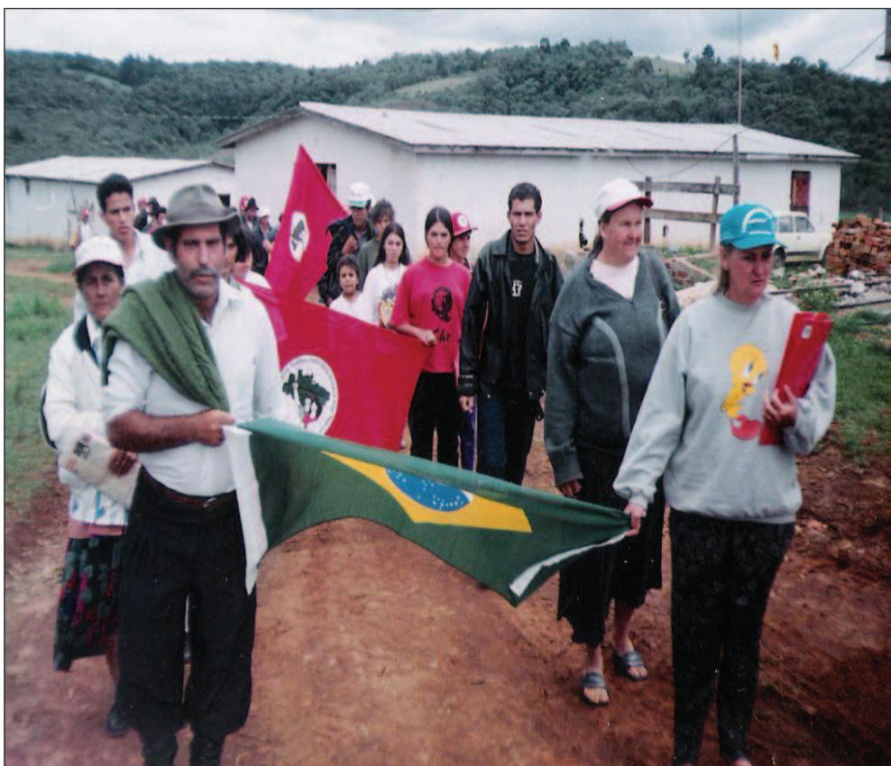
Figura 6: Imagem do dia da ocupação definitiva da fazenda Guarauninha - P.A. Ernesto Che Guevara - Foto cedida por Adelir do P.A. Ernesto Che Guevara.

Após a conclusão da vistoria, os assentados voltaram à fazenda para a ocuparem em definitivo e dar início ao P.A., conhecido até hoje pelo nome de Projeto de Assentamento Ernesto Che Guevara.