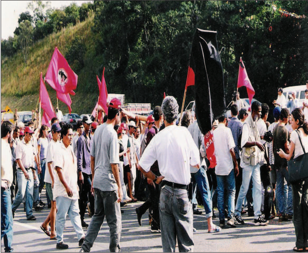
Figura3: Imagem da manifestação na estrada de Curitiba, onde dois dias antes houve o conflito com a policia que resultou na morte de um Lider do MST - Foto cedida por Adelir do P.A. Ernesto Che Guevara.

Tamanha manifestação e repúdio por parte dos manifestantes não passaria despercebida. Como ato simbólico à morte do líder sem terra foi erguido um monumento em sua homenagem no local do conflito. O projeto foi feito por Oscar Niemeyer, reconhecido arquiteto brasileiro.