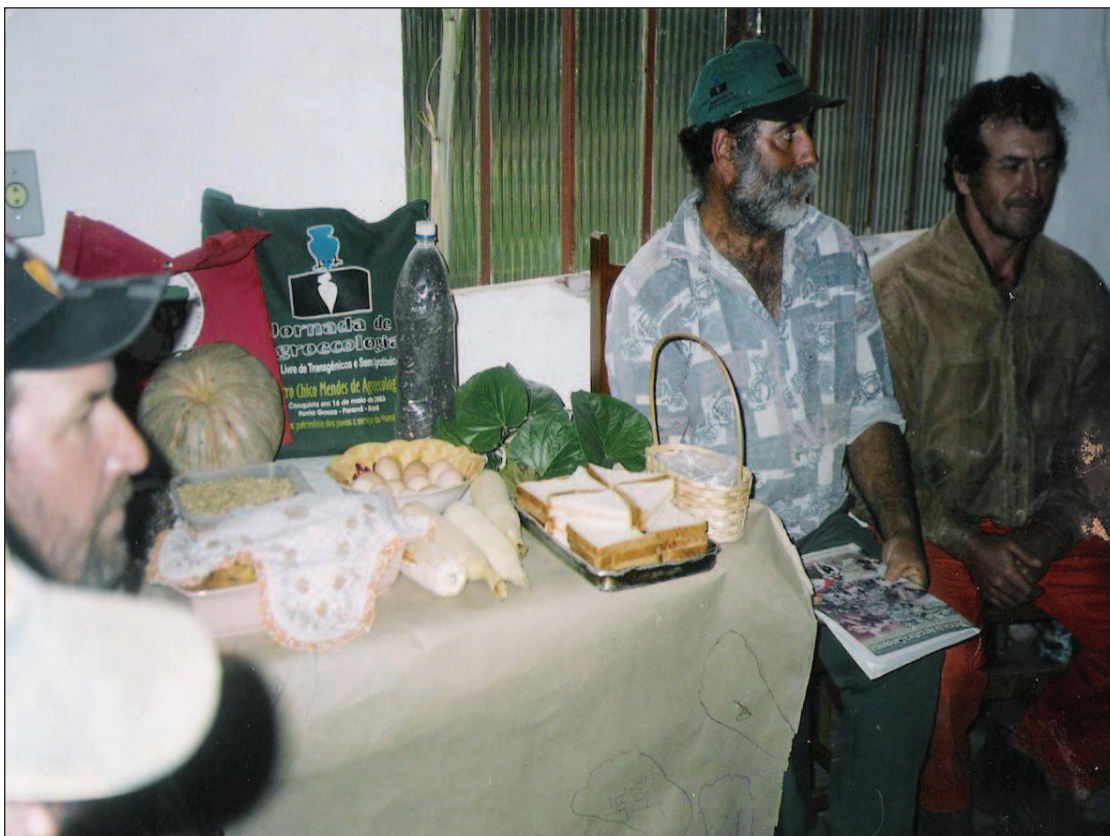
Figura 7: Reunião no P.A. Ernesto Che Guevara para tratar de assuntos referentes a agorecologia/produção de hortaliças

- Ecologia, e repassa seus conhecimentos aos outros assentados. Adelir, apesar de pouca instrução escolar, acumulou vasto conhecimento sobre o assunto e se mostra aberto a novas técnicas, principalmente voltadas à agricultura. “Eu sempre tô indo atrás de informação, sempre busco livros novos sobre agro-ecologia, e quando o técnico vem aqui eu pergunto bastante” 47 .