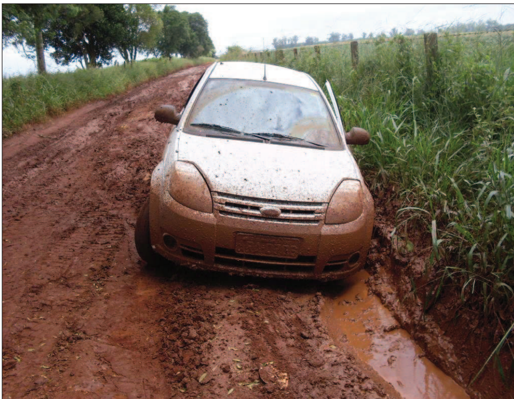
Figura 8: Imagem da situação das estradas de acesso ao P.A. Ernesto Che Guevara