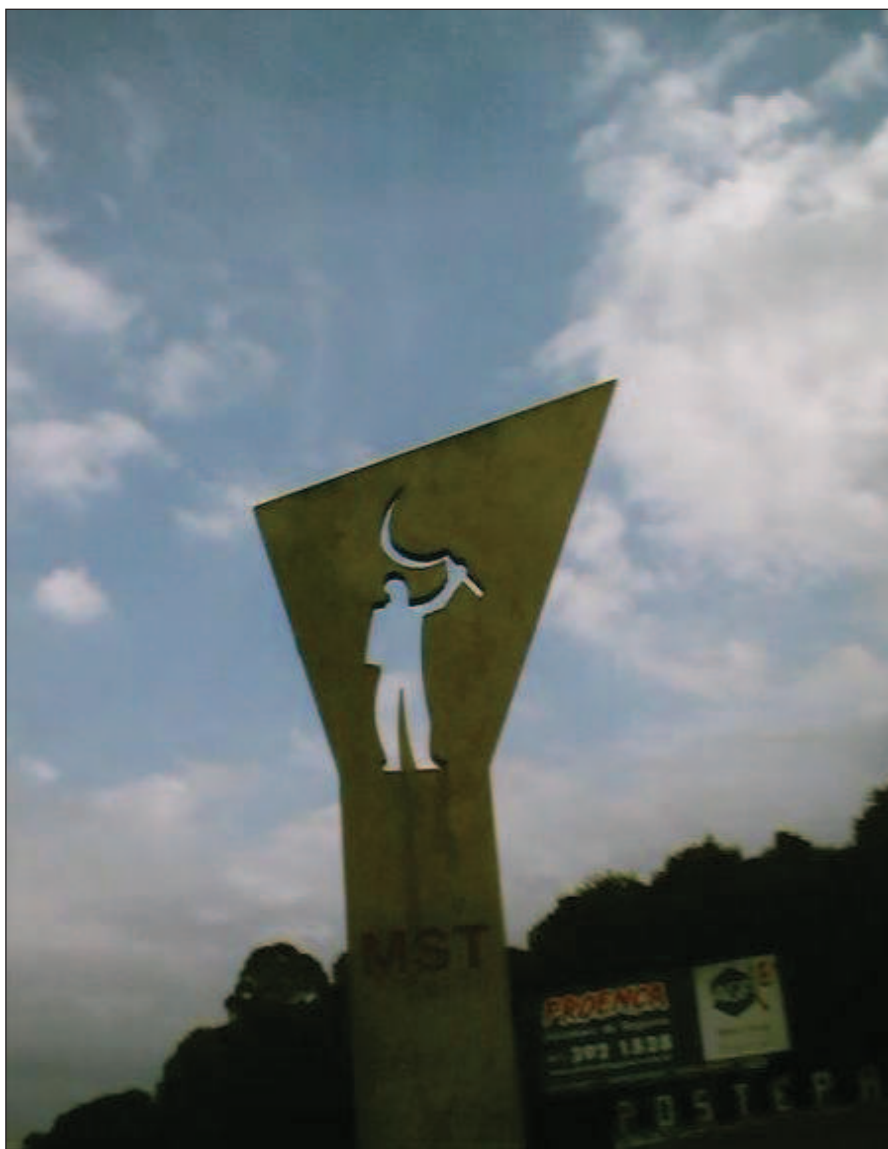
Figura4 Monumento MST - Curitiba PR 30

Portanto, por esses motivos, nosso estudo sobre o MST direcionou-se ao Paraná, limitando-se ao estudo de caso de um assentamento no interior do estado. Seria pretensioso tentar abordar o movimento em todo território nacional.