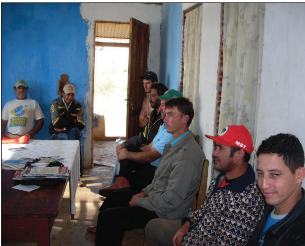
Figura 16: Assembleia para elaboração do projeto: Compra Antecipada em 2009 – Foto: Léo Heraki

Dessa forma, nota-se que o P.A. Ernesto Che Guevara enfrenta diariamente problemas e dificuldades que muitas vezes contribuem para uma imagem negativa do MST.