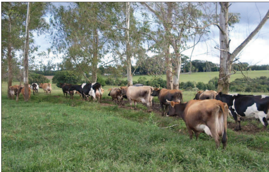
Figura 12: Criação de gado leiteiro de Eduino /P.A. Ernesto Che Guevara

Como a produção de leite de Eduino era relativamente grande, ele conseguiu resolver seu problema, causado pelo não acesso dos caminhões que recolhiam o leite em dias de chuva, devido às más condições das estradas. Com o lucro obtido, conseguiu comprar um resfriador, onde podia armazenar seu produto por alguns dias, até o caminhão ter acesso ao P.A.