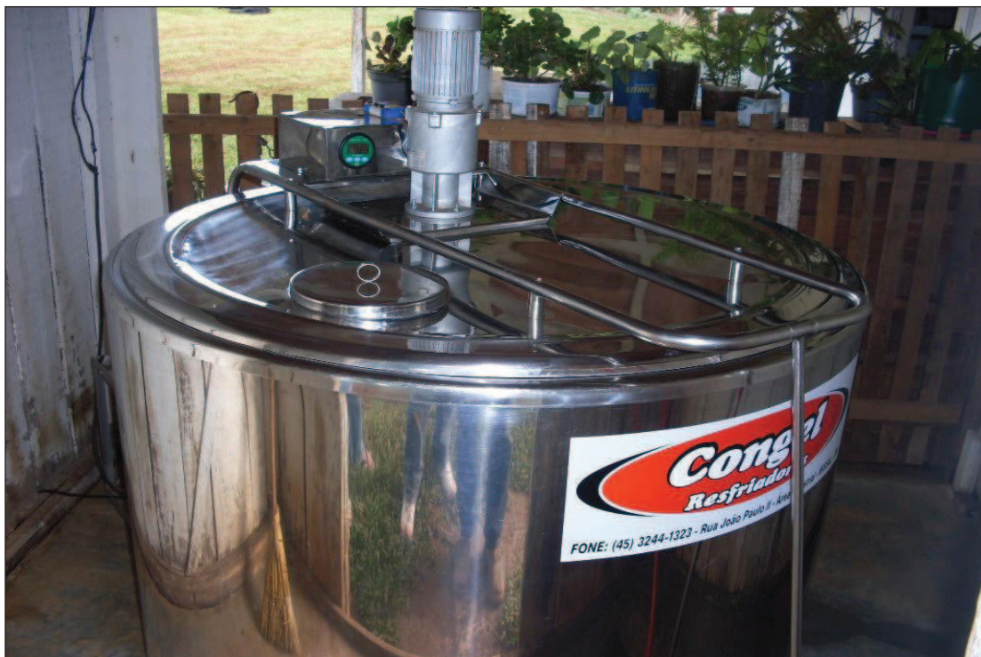
Figura 13: Resfriador de leite de Eduino/ P.A. Ernesto Che Guevara - Foto: Léo Heraki

Eduino relata que ainda terá que aumentar a capacidade de armazenamento, pois sua criação de gado aumenta devido à procriação natural dos animais e, com isso, no futuro necessitará se adequar.