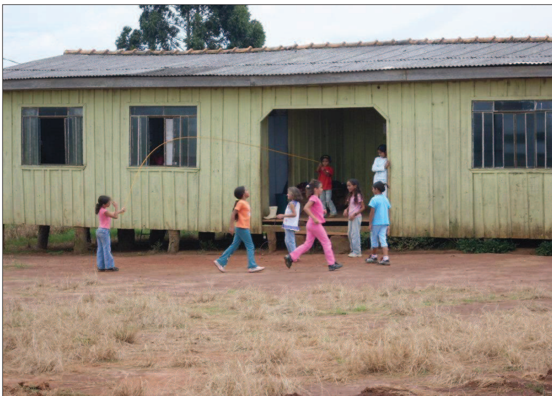
Figura 14: Imagem da Escola dentro do P.A. Ernesto Che Guevarra

Em relação à educação, houve pouco progresso nesses treze anos de história do P.A. No assentamento existe uma escola de ensino fundamental que atende boa parte das crianças do assentamento, mas, ao chegarem à idade que compreende a do ensino médio, elas têm que se deslocar até a cidade de Ponta Grossa.