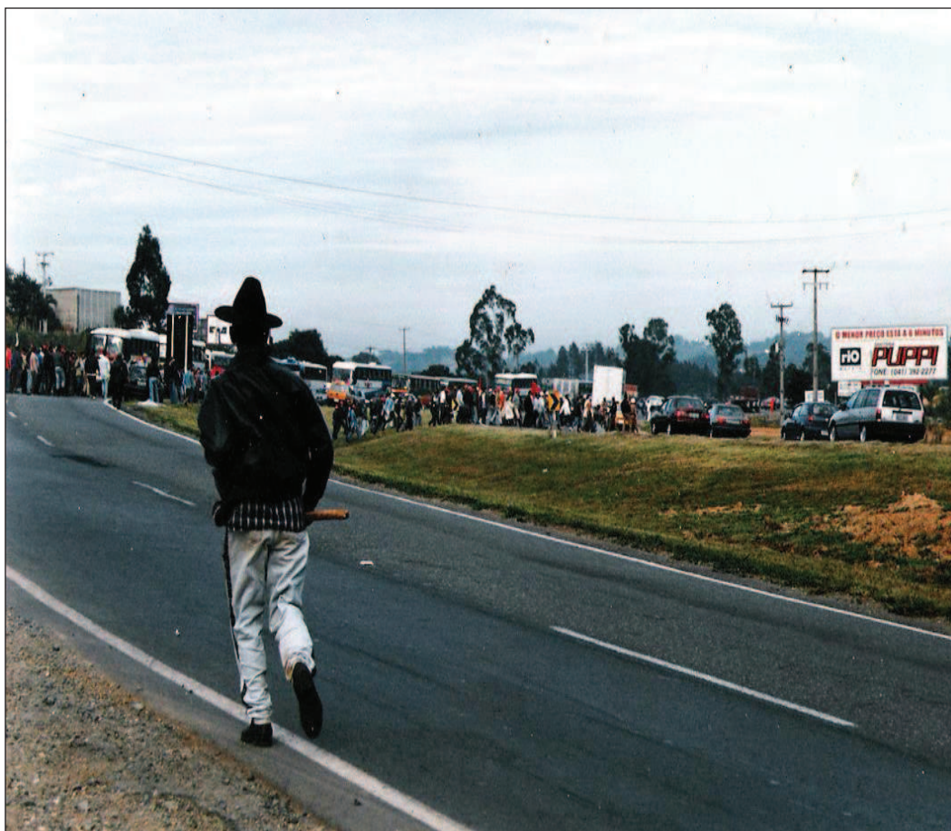
Figura 2: Imagem do conflito no Paraná em 2000.