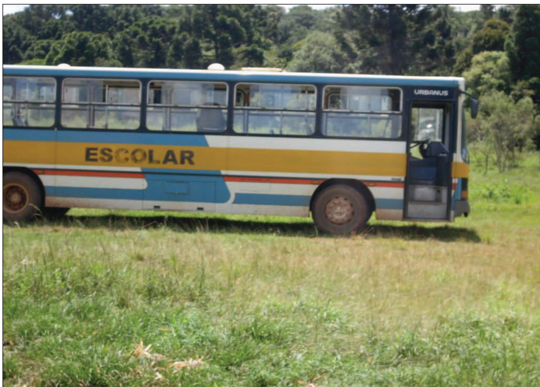
Figura 15: Ônibus usado para transporte escolar das crianças do P.A. Ernesto Che Guevara.

às más condições das estradas, acabam indo na maioria das vezes a pé ou simplesmente não indo.