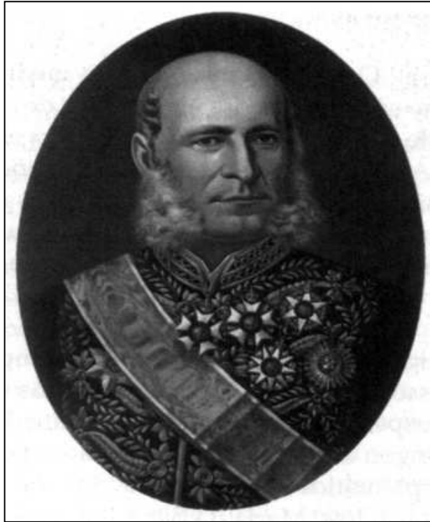
Figura 2. José Maria da Silva Paranhos, o Visconde do Rio Branco. Membro do Partido Conservador, Paranhos era um dos poucos políticos em que Mauá confiava, por isso tornou-se seu amigo.

Já a intervenção no Uruguai em 1864 e a assinatura do Tratado da Tríplice Aliança contra o Paraguai em 1865 foi elaborado por um Gabinete Liberal, chefiado por Zacarias de Góes e Vasconcelos, o maior desafeto político de Mauá.