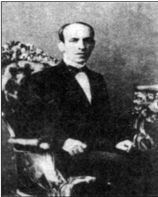
Figura 3. Zacarias de Góes e Vasconcelos. Líder do Partido Liberal, ele foi o maior adversário político de Mauá.

Imperador, acabou estabelecendo boas relações com a corte. Todavia, Pedro II orientava seus ministros e conselheiros a criarem leis que limitassem a iniciativa particular do empresariado brasileiro. Dom Pedro acreditava que os rumos econômicos do país deveriam ser organizados pela ação do Estado. Por isso, a relação política de Pedro II com Mauá nunca foi muito sólida, apesar das simpatias que um nutria pelo outro.