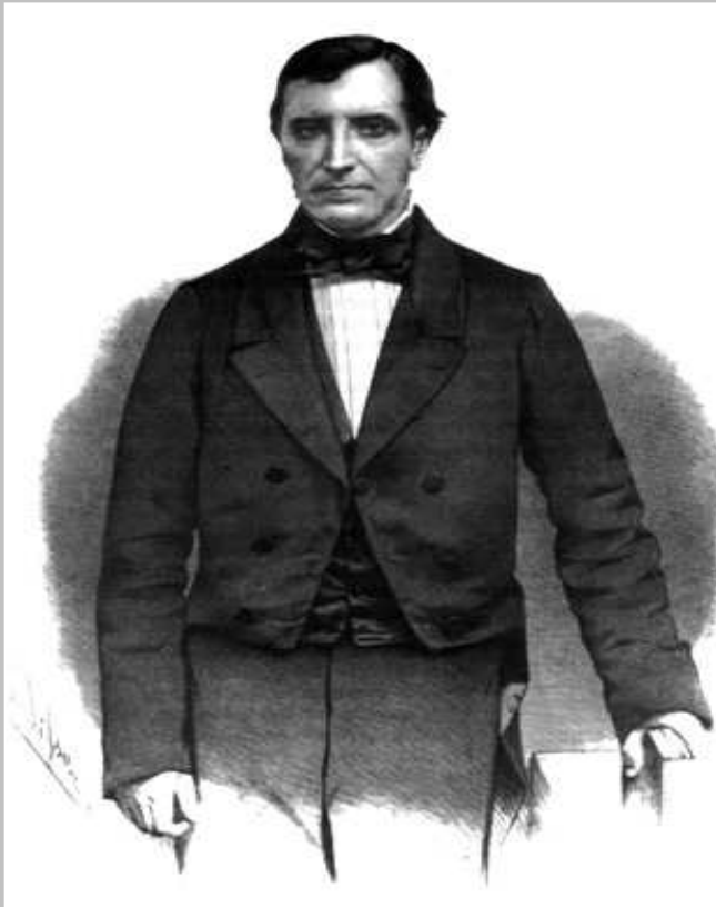
Figura 1. O Barão de Mauá: final da década de 1850

O Visconde de Mauá faleceu no dia 21 de outubro de 1889, aos 75 anos de idade, em Petrópolis. Foi sepultado no dia seguinte no cemitério da Ordem de São Francisco de Paula, na cidade do Rio de Janeiro.