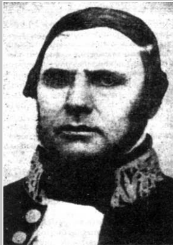
Figura 6. General Justo José Urquiza: Foi um dos principais políticos argentinos do século XIX e tornou-se amigo e cliente de Mauá. Nascido em Entre-Rios em 1800, filho do comandante militar dessa província, Urquiza entrou para o exército e alcançou rapidamente altos postos. Em 1842, assumiu o governo de Entre-Rios. Em 1850, tornou-se o comandante em chefe das operações militares contra Oribe e Rosas. Foi presidente da Confederação argentina de 1852 a 1862.

interesses políticos do Império, pois tanto o uruguaio colorado Venâncio Flores quanto o argentino Bartolomé Mitre eram considerados como aliados do governo brasileiro e como tal tratados pelos políticos do Brasil.