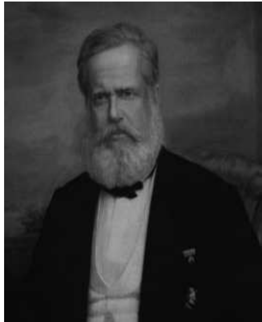
Figura 4. Dom Pedro II. Nem sempre o imperador do Brasil simpatizava com os interesses de Mauá.