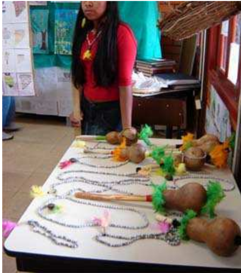
Figura 25: Exposição de trabalhos

Esta essência foi aparecendo pelas dimensões que a constituem como: Interdisciplinaridade, Auxílio governamental e a Metodologia do ensino.