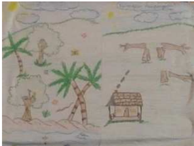
Figura 13: Desenhos dos alunos sobre a paisagem natural