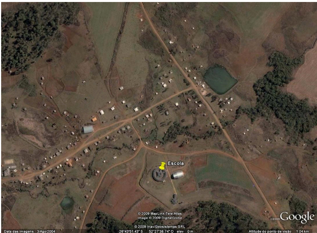
Figura 1: Localização da aldeia indígena kaingang em relação à cidade de Chapecó - SC