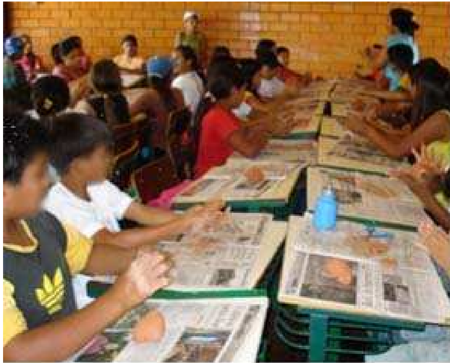
Figura 23: Alunos em aulas de artes

Esta essência foi surgindo no transcorrer das minhas visitas à escola indígena e minha convivência com a comunidade escolar. Primeiramente, mantive contato com o cacique, que é o primeiro a ser consultado para qualquer ingresso na aldeia e me recebeu com muita cortesia, autorizando minha pesquisa. Acredito que contribuiu para isso ter sido acompanhada por uma amiga professora que já havia feito uma pesquisa na aldeia sobre dança Kaingáng .