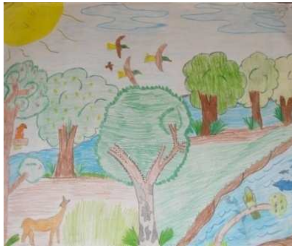
Figura 16: Desenhos produzidos sobre o modo de vida do índio