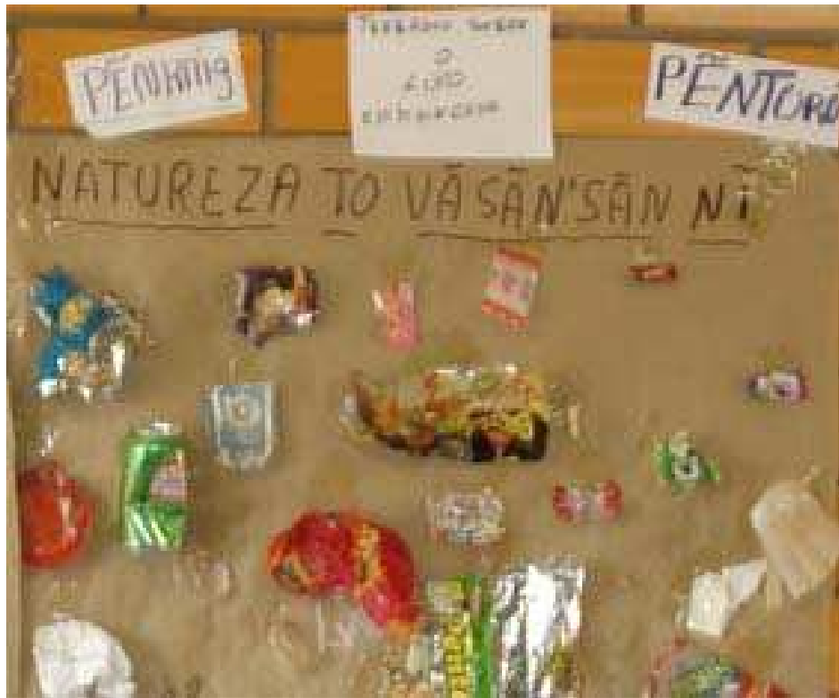
Figura 26: Trabalhos desenvolvidos pelos alunos

Esta essência surgiu baseada nos trabalhos que são desenvolvidos na escola, atividades que retratam muito as suas vivências, sua cultura e sua gente. A reserva é para a comunidade sua morada e seu lugar de segurança, é nesse espaço que os índios se sentem bem.