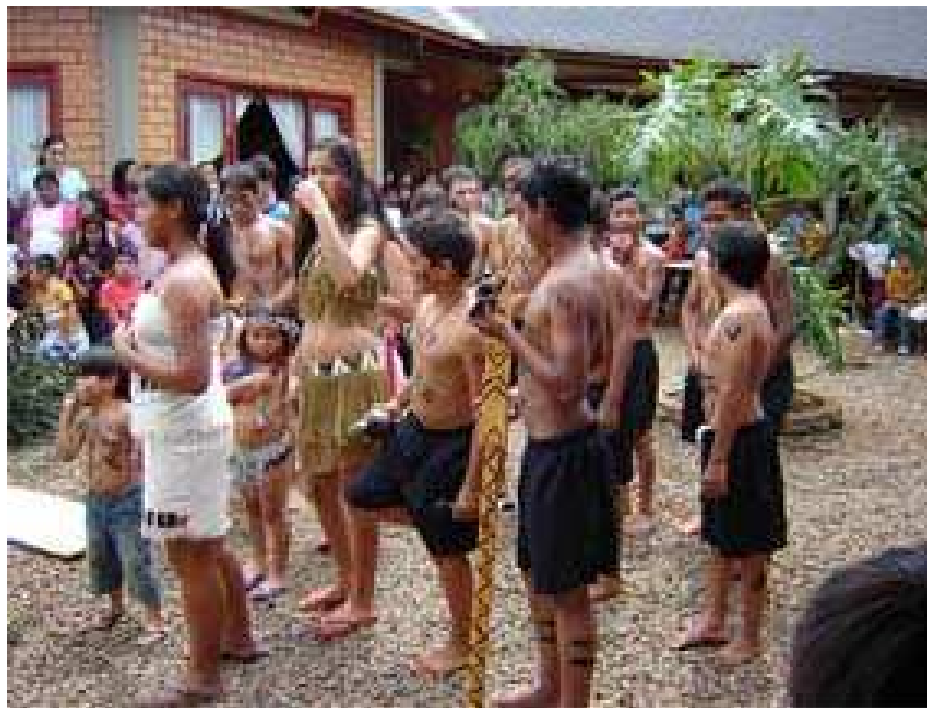
Figura 24: Comunidade escolar

Para Laraia (2008), o homem é o reflexo do meio cultural em que foi socializado. Ele é o resultado de uma caminhada marcada pelos saberes e vivências que foi adquirindo pelas gerações que o antecederam.