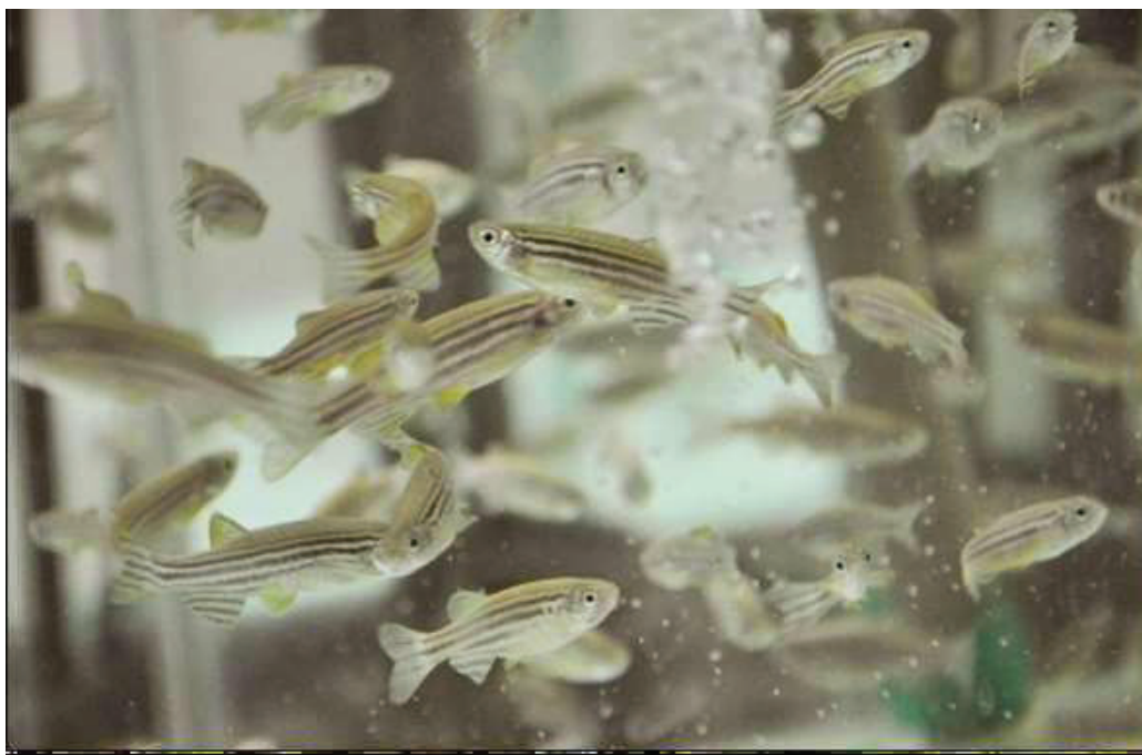
Figura 2- Imagem de um cardume de zebrafish ( Danio rerio ) no Laboratório de Fisiologia de Peixes da Universidade de Passo Fundo, RS.

fazem ser um modelo amplamente utilizado nas pesquisas científicas (KALUEFF et al., 2013).