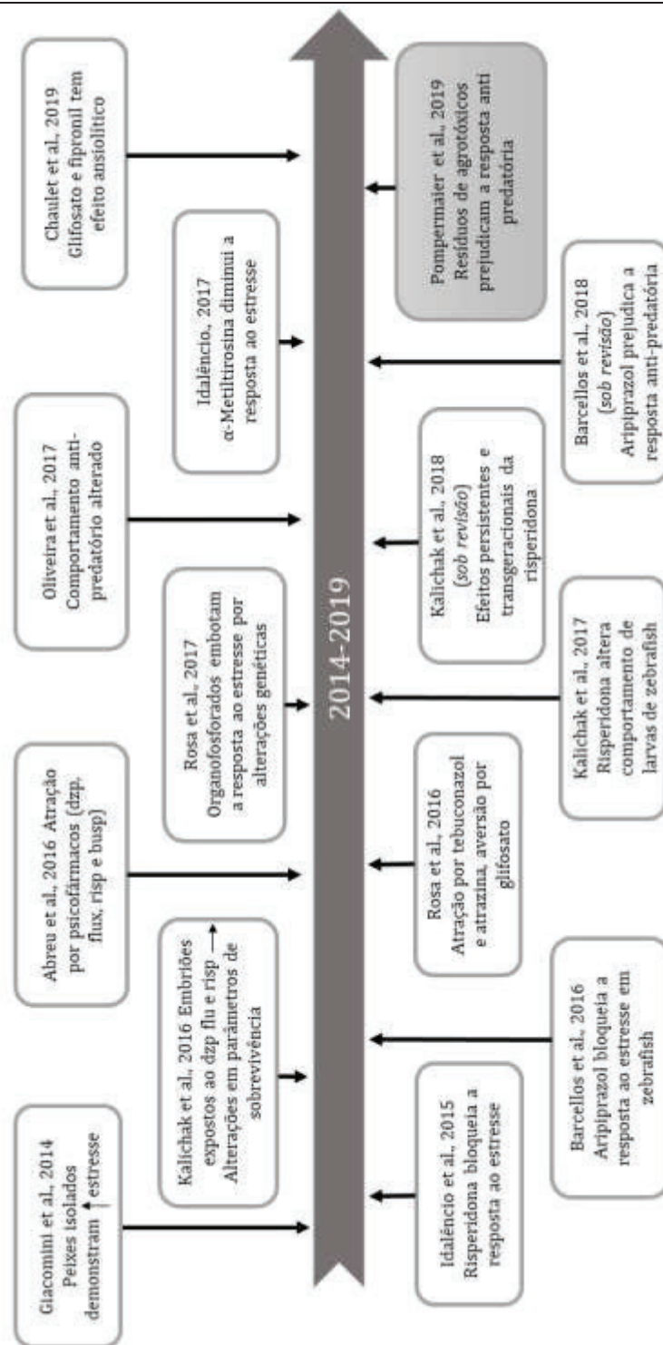
Figura 1 - Compilado das publicações do laboratório de fisiologia de peixes (UPF) sobre efeitos dos fármacos e agrotóxicos.