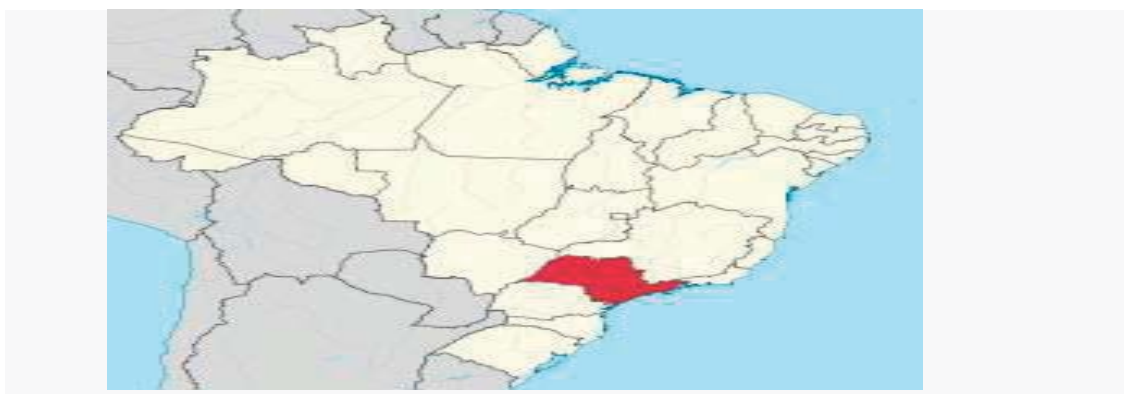
Figura 4: Localização de São Paulo