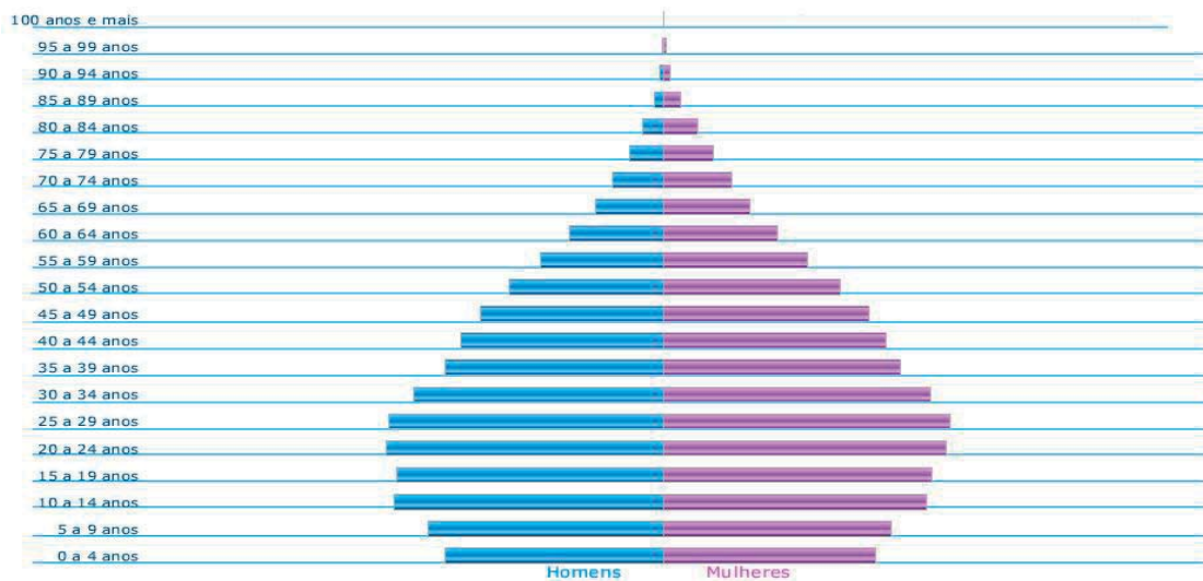
Figura 1: Envelhecimento da população brasileira por sexo, no ano de 2010.

Compreender o envelhecimento da população é um dos desafios decorrentes da expansão da população idosa. Isso reforça a ideia de contemplarmos a pirâmide etária brasileira, onde, atualmente apresenta configuração bastante modificada.