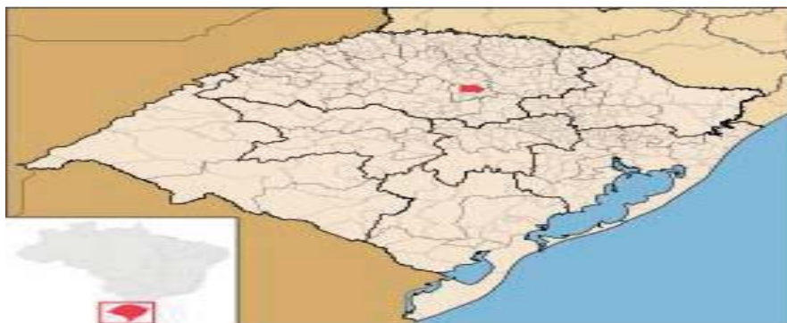
Figura 2: Localização de Não-Me-Toque no Rio Grande do Sul