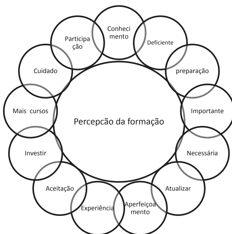
Figura 5 – Diagrama da percepção da formação expressa em palavras